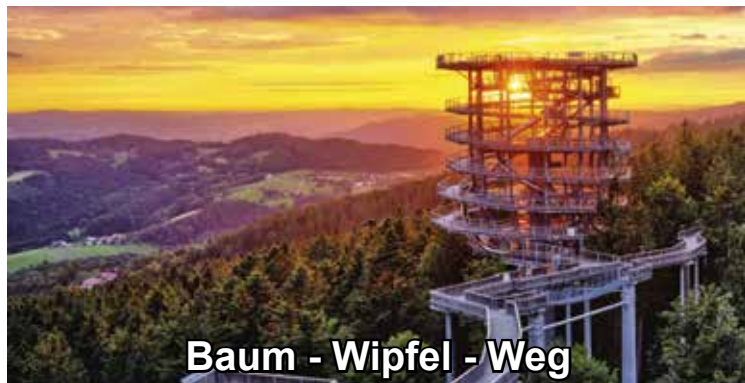
Baum - Wipfel - Weg