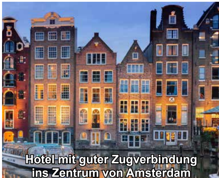
Hotel mit guter Zugverbindung ins Zentrum von Amsterdam