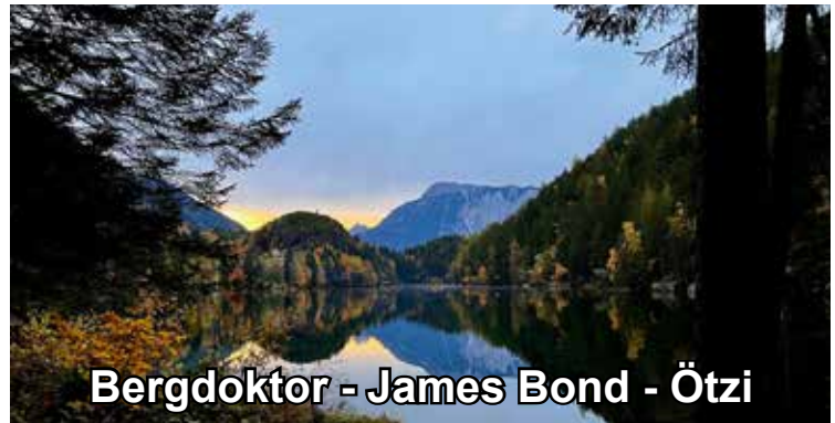
Bergdoktor - James Bond - Ötzi