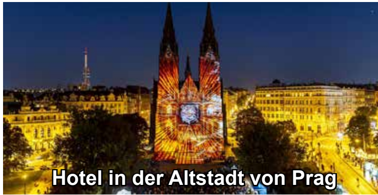
Hotel in der Altstadt von Prag