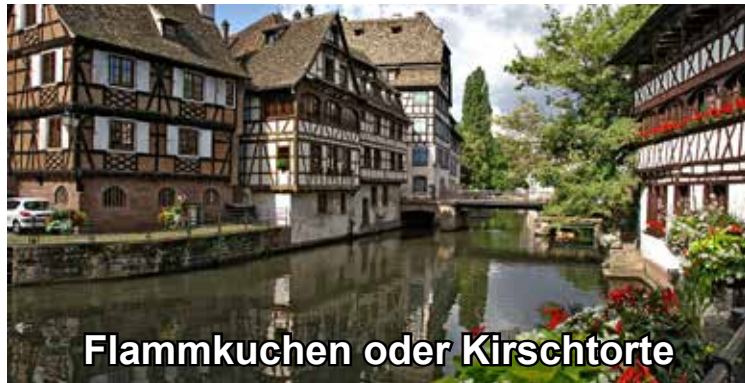
Flammkuchen oder Kirschtorte