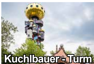
Kuchlbauer - Turm